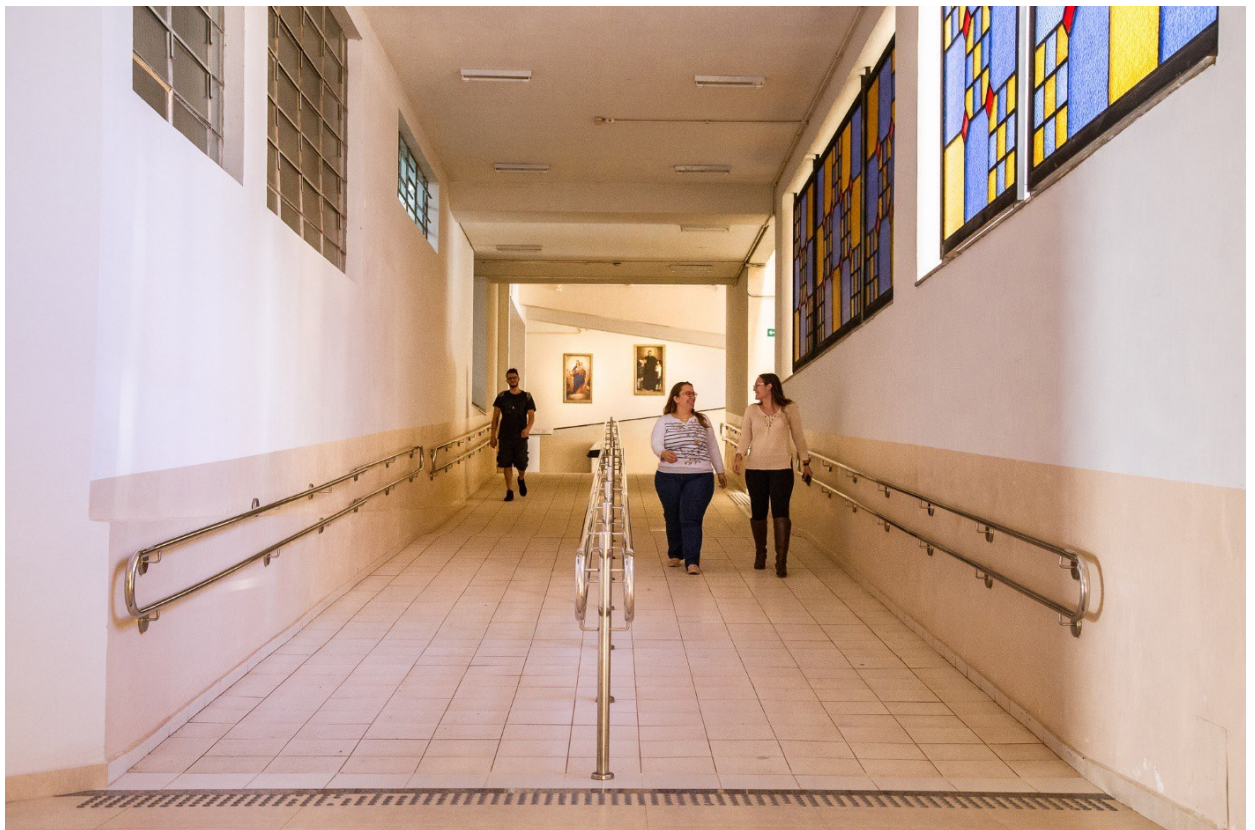
SALAS DE WI-FI